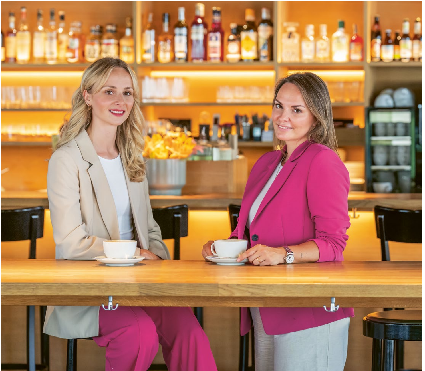
Die Co-Leiterinnen im Café, wo alles begann.

Wir wollen vor allem ihre Produktideen challengen, um für unsere Kundinnen und Kunden die besten Produktlösungen anbieten zu können.