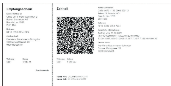
QR-Rechnung mit Creditor Reference und IBAN (neue Nutzungsmöglichkeit)

Die QR-Referenz entspricht der heutigen ESR-Referenz und dient dem einfachen Abgleich von Rechnungen mit Zahlungen beim Rechnungssteller. Bestehende ESR-Referenznummern können weiterhin verwendet werden, wodurch der nahtlose Übergang von der ESR zur QR-Rechnung möglich ist. Die QR-Referenz darf nur mit der so genannten QR-IBAN genutzt werden. Die QR-IBAN ist im E-Banking unter Finanzen – Kontoauszug -Kontoinformationen (Ende April 2020) ersichtlich. Ansonsten dürfen Sie sich auch gerne bei Ihrem/Ihrer Kundenberater/in melden.