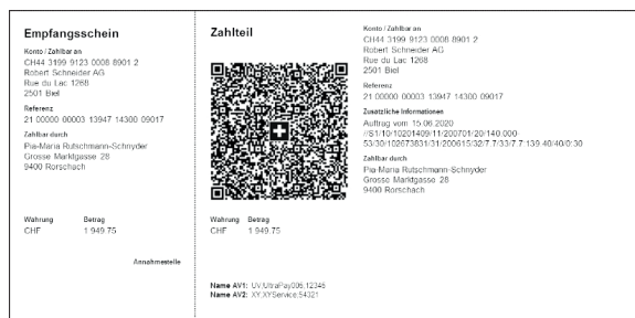
QR-Rechnung mit QR-Referenz und QR-IBAN (ersetzt den orangenen Einzahlungsschein)